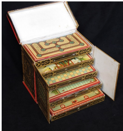
“Bicycleclub” (Æ Spielsammlung), Adolf Engel, Alemanía, vers 1900

També el joc de la dècada de 1890 “Cycling (a fascinating game by JAP)”, fabricat per J.W.Spears & Sons a Anglaterra, així com el joc “Das Radfahrerspiel”, fabricat a Alemanya a la dècada de 1880.