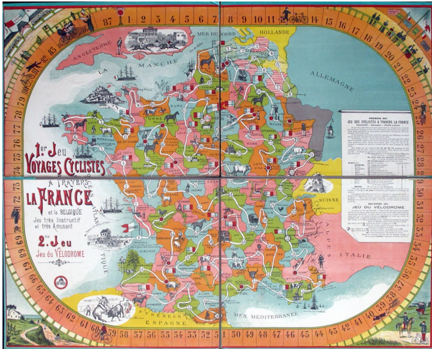
“Nos ciclistes à travers la France et la Belgique”, Saussine, França, dècada de 1890