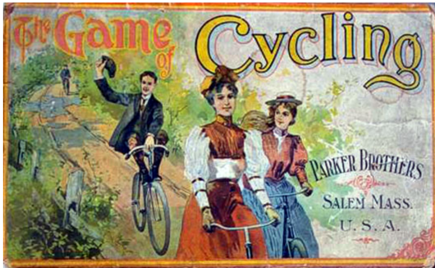
"The Game of Cycling". Parker Brothers, Estats Units, 1900

a la producció de molts jocs de carreres de bicicletes, entre ells els que exposen en aquesta mostra. Podríem dir, amb tota propietat, que aquesta és una exposició de jocs de ciclisme de l'edat d'or.