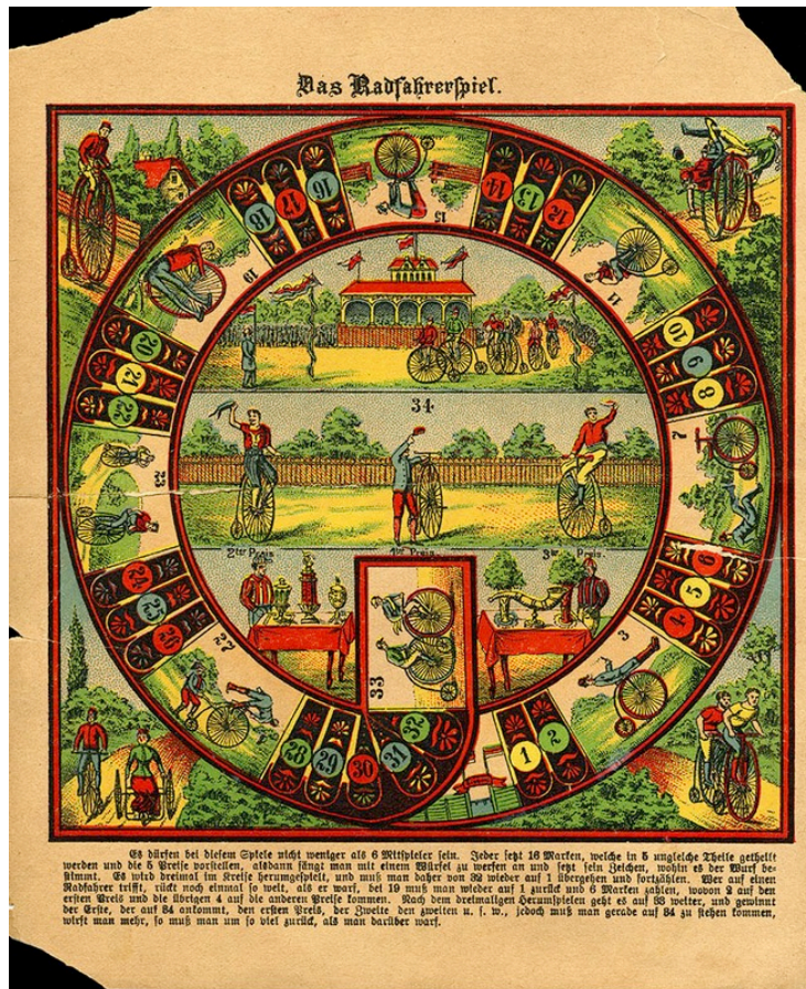
“Das Radfahrerspiel”, Alemanya, dècada de 1880.

Així com el joc “Nos cyclistes à travers la France et la Belgique”, fabricat per Saussine a França, a la dècada de 1890, entre molts altres.