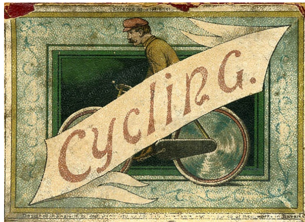
“Cycling”, J.W.Spears & Sons, Anglaterra, dècada de 1890

També el joc de la dècada de 1890 “Cycling (a fascinating game by JAP)”, fabricat per J.W.Spears & Sons a Anglaterra, així com el joc “Das Radfahrerspiel”, fabricat a Alemanya a la dècada de 1880.